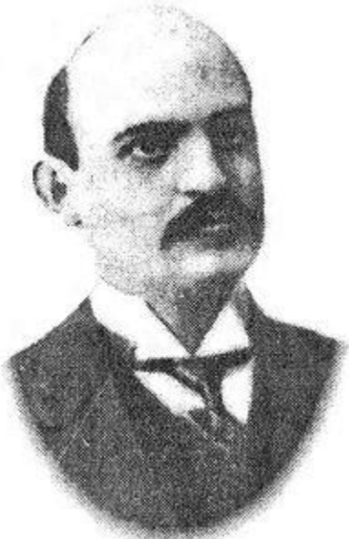
Istoricul Constantin Giurescu