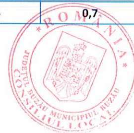
Tabelul 2: Indicii parțiali calculați prin excluderea din IPC a anumitor componente

Datele tabelului (xls) vor putea fi accesate prin fișierul .rar atașat comunicatului pe homepage