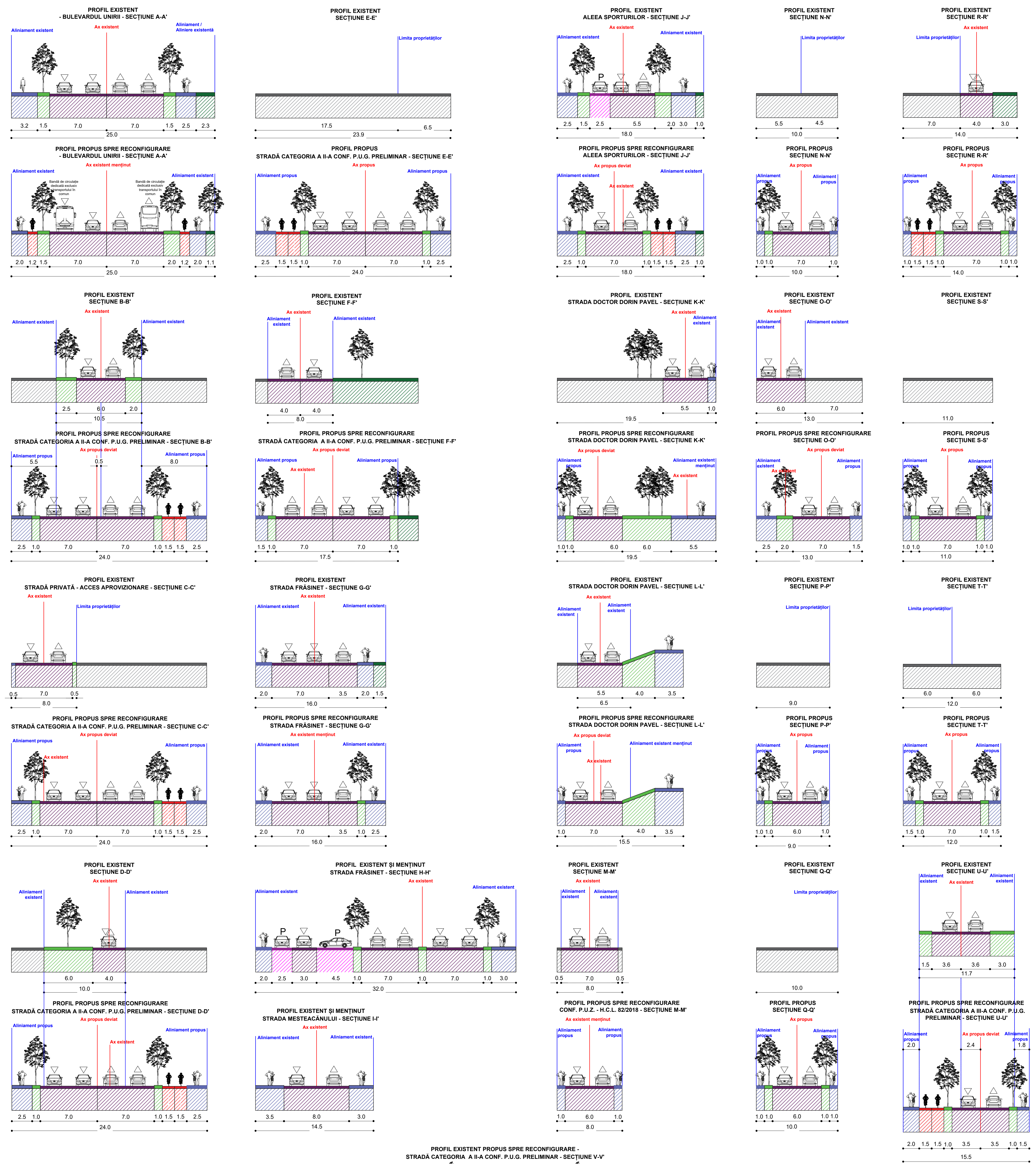
SECȚIUNI STRADALE CARACTERISTICE - SC. 1:200