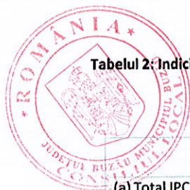
Tabelul 2: Indicii parțiali calculați prin excluderea din IPC a anumitor componente

Datele tabelului (xls) vor putea fi accesate prin fișierul .rar atașat comunicatului pe homepage .